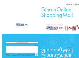
コンテンツ一部抜粋