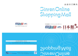
コンテンツ一部抜粋