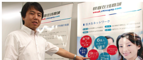
パンフレットを基にセミナー用タペストリーも作成

非常に評判が良いので、何度も増刷を繰り返し使用しております。スリーシーズからは「情報の新鮮さ」について口を酸っぱく言われておりますので、新しい情報があれば、すぐに更新し使用しております。このパンフレットの他に、実際出店して頂いて喜んで頂いているお客様の成功をまとめた事例集を作りたいと考えています。少しでも多くの方に「日本館」の良さを知って、また理解して頂きたいからです。今後は中国本土を含め、プロモーション・営業強化も行っていかなければならないでしょう。その際には、ビジネスを充分理解してくれているスリーシーズと一緒に動いてもらいたいですね。